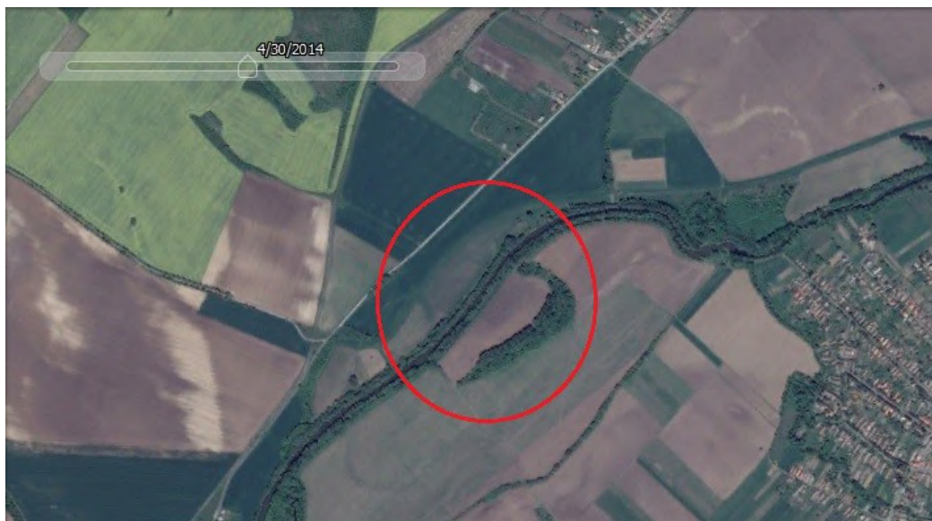
1. kép. A lelőhely műholdfelvételen

esetében lehet kiszűrni az ismeretlen régészeti lelőhelyeket, a megfelelő eljárással: megpróbáljuk észrevenni a szétszántott beásásokat. A másik fontos kiindulási pont az 1:10 000 méretarányú térképek használata, ami főleg a hegyvidéki területeken elhelyezkedő ismeretlen lelőhelyek azonosításában nyújt nagy segítséget. Ezek mellett meg kell említeni még az I. és II. katonai felmérést, a 19. századi kataszteri térképeket, a területre vonatkozó turistatérképeket és a Google Earth mellett elérhető további műholdképeket is.