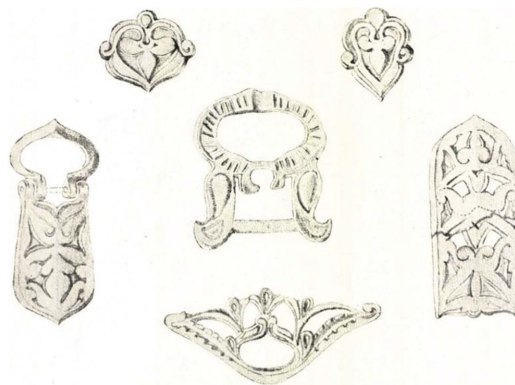
XIV. KÉP. SZÉJDISZÍTÉSEK A KENÉZLŐI 1. ÉS 3. FELDÜLT SÍRBÓL. 1/2. n.